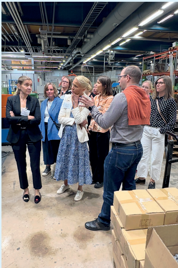
Enston tehdaskierros kiinnosti osallistujia.