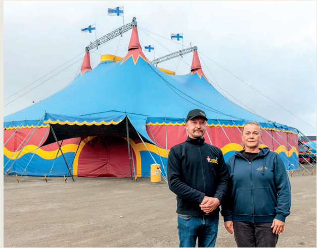
Elämä yhtä sirkusta – pian 50-vuotias Sirkus Finlandia on perheyritys toisessa polvessa. Sivu 18