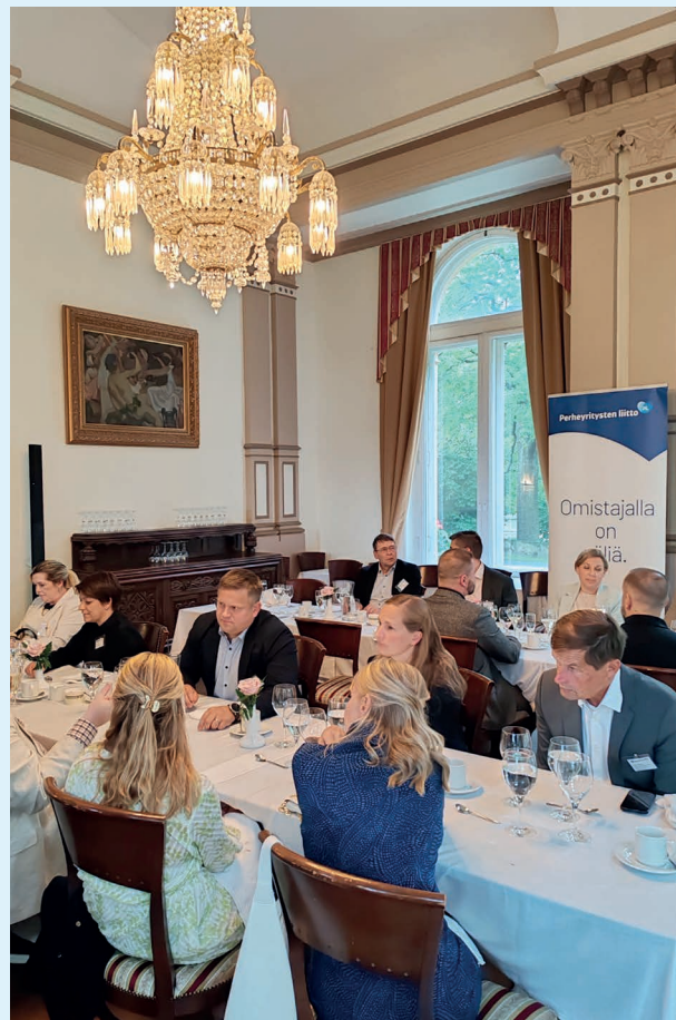
Tampereella vietettiin rento verkostoitumisillallinen Finlaysonin Palatsilla elokuussa.