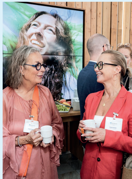
Valtuuskunnan kokouksessa Fennialla vaihdettiin kuulumiset kesän jälkeen.