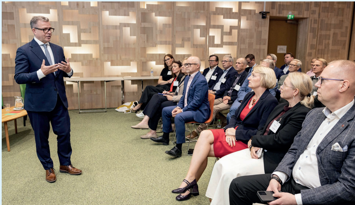
Pääministeri Petteri Orpo toi tervehdyksen Perheyritysvaltuuskunnalle.