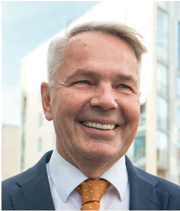
Pekka Haavisto Kansanedustaja, Vihreät Eduskunta