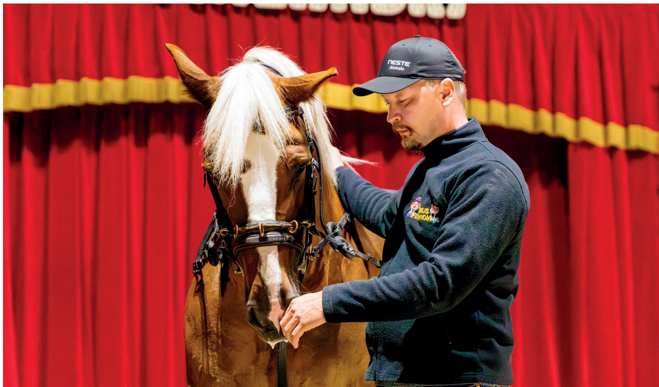
Yhteistyö sirkuksessakin vaatii toistoja ja kärsivällisyyttä. Eläimet ovat yksilöitä, kuten ihmisetkin.

Euroopan sirkusperheet, joista pohjoismaiset sirkukset ovat kaikkein tutuimpia. Teemme paljon yhteistyötä keskenämme ja olemme muutenkin yhteydessä toisiimme”, Calle sanoo.