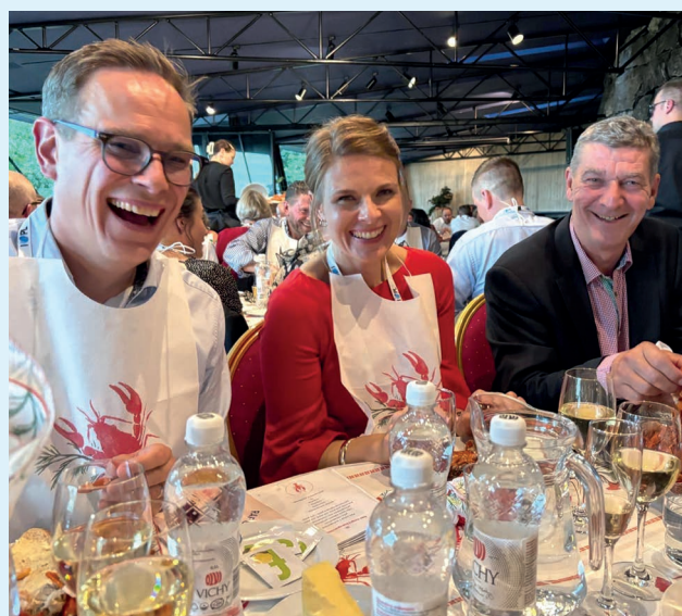
Perheyrittäysrapuja nautittiin yhdessä elokuussa Villa Hakassa.